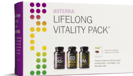
dōTERRA Lifelong Vitality Pack™*

Das dōTERRA Lifelong Vitality Pack™, eines von dōTERRAs beliebtesten Lifestyle-Produkten, ist vollgepackt mit vitalitätsfördernden Eigenschaften. Mit dem dōTERRA Lifelong Vitality Pack ist es bequem und erschwinglich, den ersten Schritt auf dem Weg zu einem Leben voller Vitalität und Wohlbefinden zu gehen.