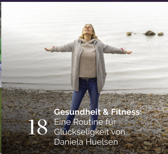
18 Gesundheit & Fitness: Eine Routine für Glückseligkeit von Daniela Huelsen