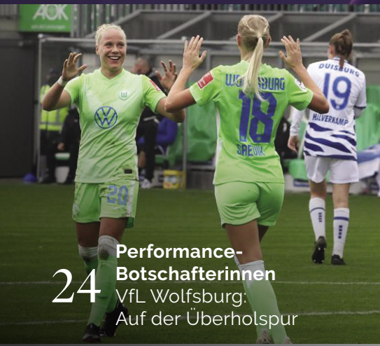
24 Performance-Botschafterinnen VfL Wolfsburg: Auf der Überholspur