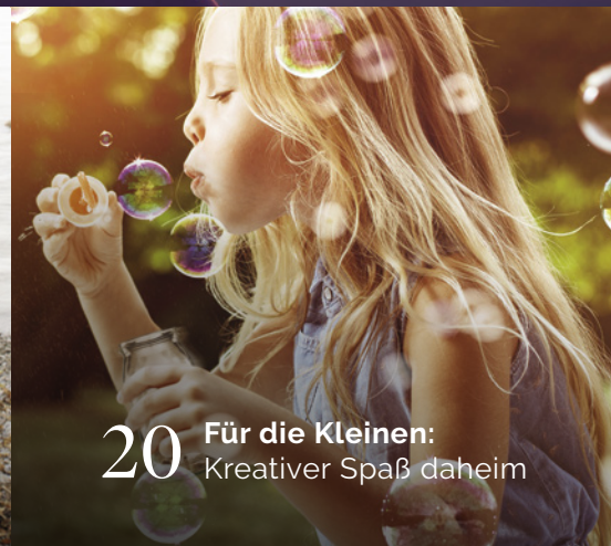
20 Für die Kleinen: Kreativer Spaß daheim