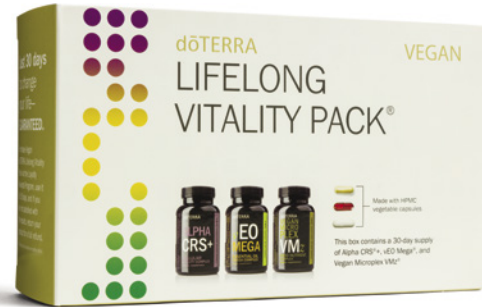
dōTERRA Lifelong Vitality Pack™ Vegan*